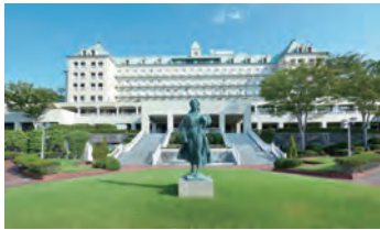
静岡カントリー浜岡コース&ホテル 様