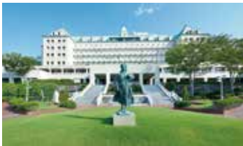
静岡カントリー浜岡コース&ホテル 様