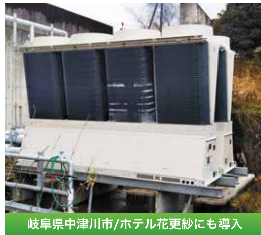
岐阜県中津川市/ホテル花更紗にも導入